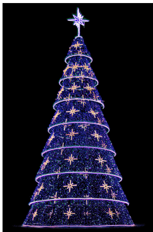
Árvore de 14 m