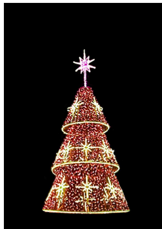
Árvore de 6 m