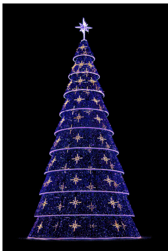
Árvore de 17 m.