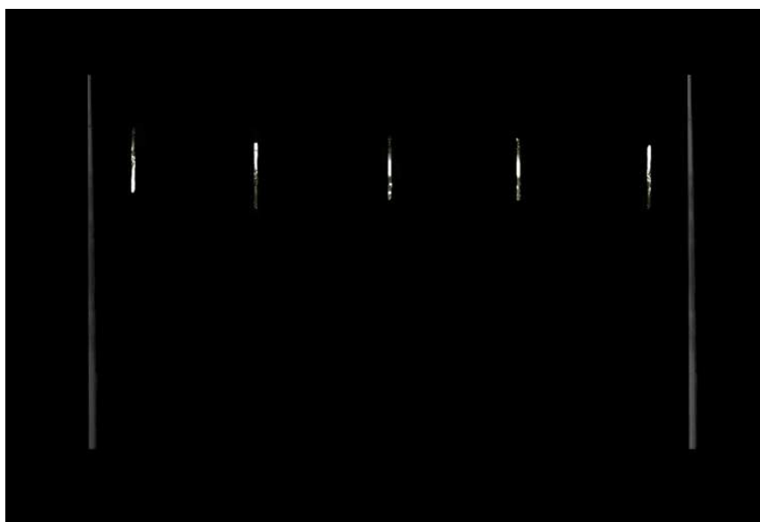
Transversais com snow falls