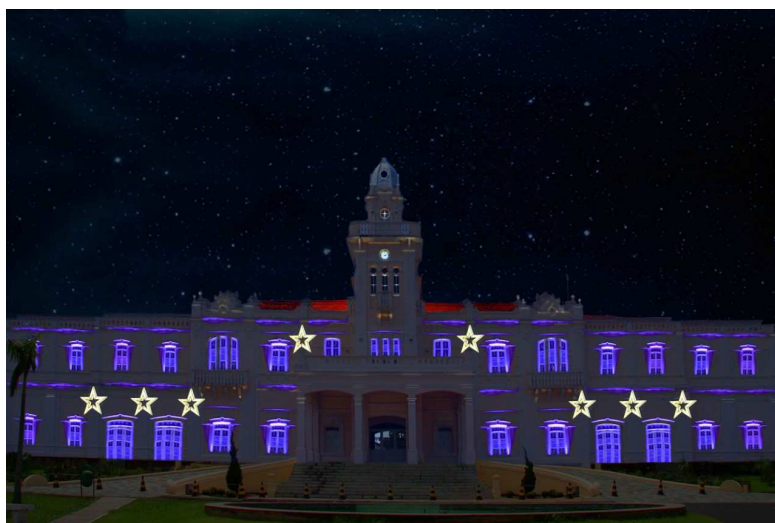
Palácio dos Ferrovários